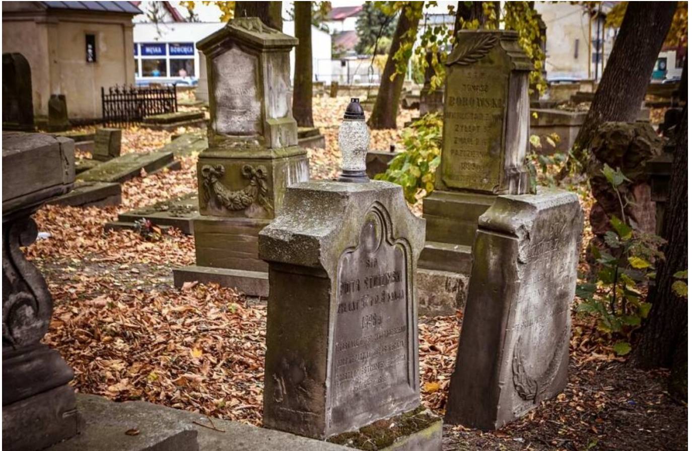
(Fot. Sławomir Burzyński)

data aktualizacji: 2021.10.29 autor: Sławomir Burzyński