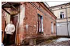
Pogorzelnicy z ulicy Rawskiej