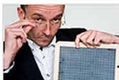
Chciecie strajku? Będą kontrole