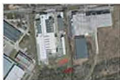
Kolonia karna na terenie Skierńewic