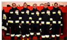
Nowy samochód już w naprawie