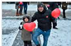
Skierńiewiczanie solidarni z Owsiakiem