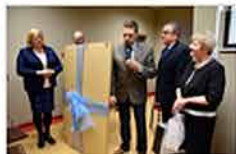
Rocznik klubu seniora na Rawce