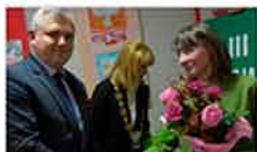
Rada ma więcejprzewodniczącą