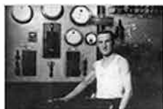
Jak zelektryfikowano Skierńewic