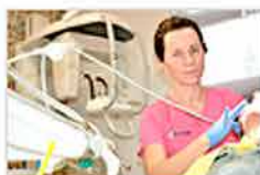
Rośnie bezżelazne pokolenie